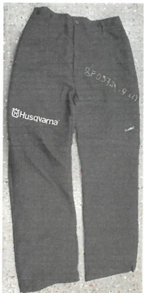
Style 220, Classic Entry