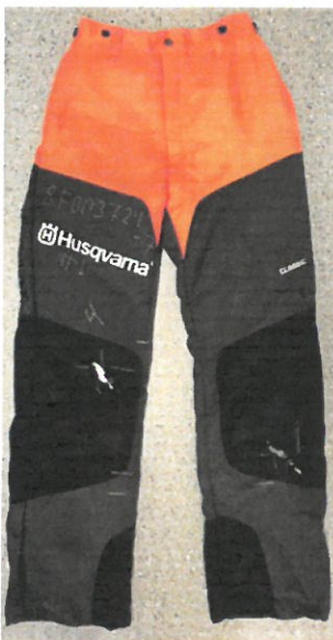
Style 220, Classic

Sizes: Style 220, Classic: 44 – 64, 44-5cm – 64-5cm Style 220, Classic Entry: 44 – 58 Style 224, Classic: 44 – 64