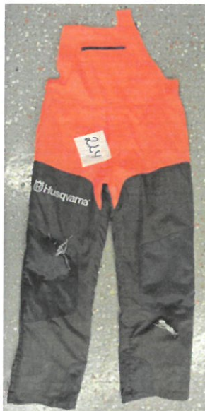
Style 224, Classic